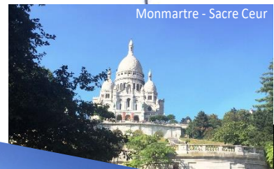
Monmartre - Sacre-Coeur