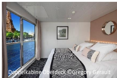
Doppelkabine Oberdeck