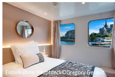
Einzelkabine Hauptdeck